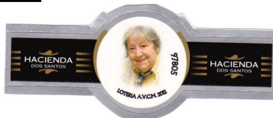
Gloria Fuertes (Poetisa)