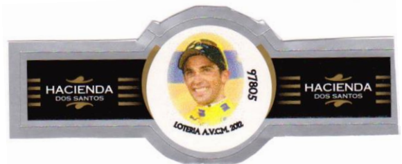
Alberto Contador (Ciclista)

La emisión tradicional de tres anillas con motivo "Personajes Madrileños", está dedicada a Gloria Fuertes (Poetisa), Pedro Duque (Astronauta) y Alberto Contador (Ciclista) . Precio 3.00 €.