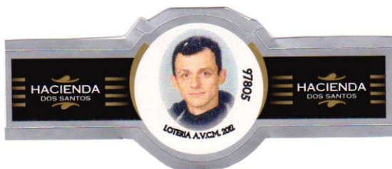
Pedro Duque (Astronauta)